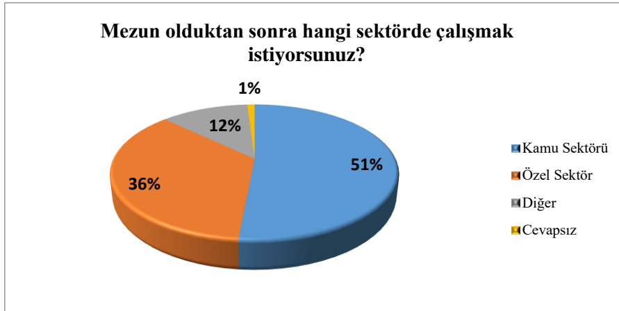
Şekil 3. Mezun Öğrencilerin Çalışmak İstedikleri Sektör Tercihleri

Çizelge 3'te mezun öğrencilerimizin değerlendirme sorularına verdikleri cevapların yüzde dağılımları bulunmaktadır.