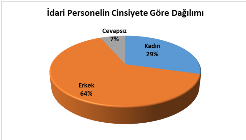
Şekil 1. İdari Personelin Cinsiyete Göre Dağılımı

Sinop Üniversitesinde çalışan 354 idari personele uygulanan anket sonuçlarına göre, katılımcıların cinsiyete göre dağılımı Şekil 1’de verilmektedir.